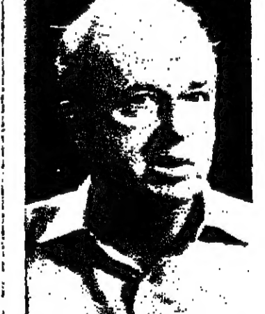
المرشد الذي قام إسرائيل لا وجبت التربة الشرق اوسطية ولا ارتفعت الاصوات التي تنادي اليوم بضرورة قيام الدولة الجديدة من ١٩٤٨.

الكويت - اتهم الشيخ عبد العزيز آل خليفة ، وزير النفط القطري شركات النفط العالمية بالمضاربة بأسعار النفط. وقد وافق المجلس الوزاري الذي تم رفعه برفع سعر البنزين بمقدار ١٠ بالمائة. وقد وافق المجلس الوزاري الذي تم رفعه برفع سعر البنزين بمقدار ١٠ بالمائة.